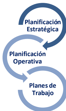
Gráfico 1: Vinculación Planificación Estratégica y Operativa